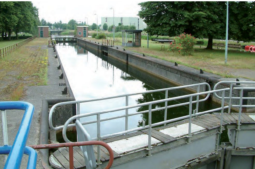
Dierense Sluis is in onbruik en raakt verder in verval. Bescherming is hard nodig.

zich bewust zijn van het eigen erfgoed en de kansen die dat biedt. Onderzocht is wat de waterschappen doen met de fysieke presentatie van erfgoed, dat wil zeggen het openstellen voor publiek van hun cultuurmonumenten. Dat kan permanent zijn georganiseerd, bijvoorbeeld in de vorm van een bezoekerscentrum met vaste openingstijden of een bezoek op afspraak. Of incidenteel als een gebouw opengesteld is tijdens bepaalde evenementen. Voor deze verkenning is nagegaan of waterschappen meedoen aan de landelijk georganiseerde Open Monumentendag. Ook hier blijken de verschillen tussen de waterschappen groot. (Figuur 3) Het Hoogheemraad-